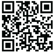
Aplikácia Govee Home

(zariadenia so systémom Android). Zapnite funkciu Bluetooth v smartfóne. Otvorte aplikáciu Govee Home a ťuknite na ikonu "+" v pravom hornom rohu. Zo zoznamu zariadení vyberte "H619C". Ťuknite na ikonu zariadenia a postupujte podľa pokynov na obrazovke na dokončenie párovania.