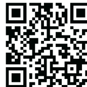
Aplikácia Govee Home

Vyberte možnosť Navádzanie a podľa pokynov na obrazovke ovládajte zariadenie hlasom.